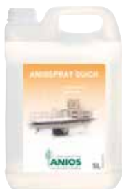
Aniospray Quick 5L