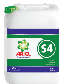
ARIEL PROFESSIONAL S4 BLANC MAX