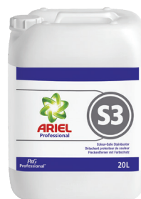
ARIEL PROFESSIONAL S3 DÉTACHANT PROTECTEUR DE COULEUR