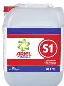
ARIEL PROFESSIONAL S1 DÉTERGENT ACTILIFT