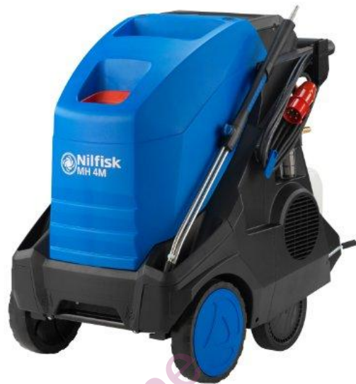
L'image affichée peut ne pas représenter le modèle proposé

Sur les modèles versions "X" l'enrouleur de flexible est parfaitement intégré à l'arrière de la machine. La plateforme arrière permet de recevoir jusqu'à 2 bidons de 10 litres de détergent ou plusieurs de 2.5 l. Les 2 crépines d'aspiration de produit autorisent l'utilisation de détergents différents.