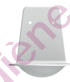
Coupelle stop gouttes (AC0170)