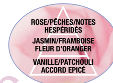
FLEUR DE LIN